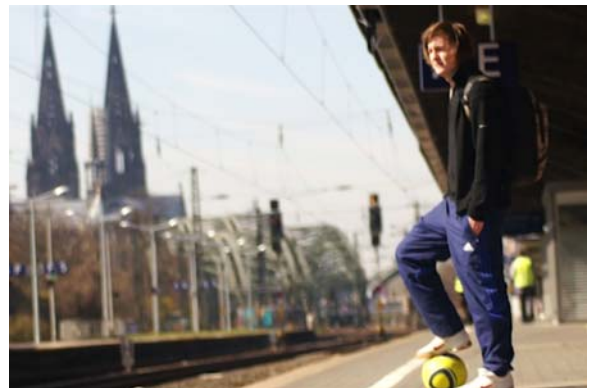
Wenn die Liebe zum Ball zur Leidenschaft wird.