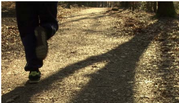
Wenn die Füße zum Leben erwachen.